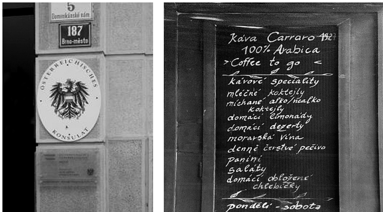
Bild 1: Österreichisches Konsulat in Brunn ( top-down landscape )